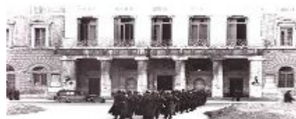
Istituto Pugliese per la Storia dell'Antifascismo e dell'Italia Contemporanea